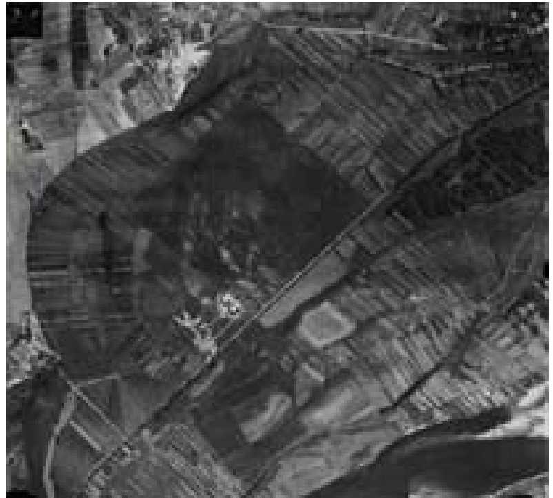
Zdjęcie przedstawiające lotnisko w Borowinie w odwozorowaniu pionowym. Stan zabudowy na wrzesień 1939 r (KCH).