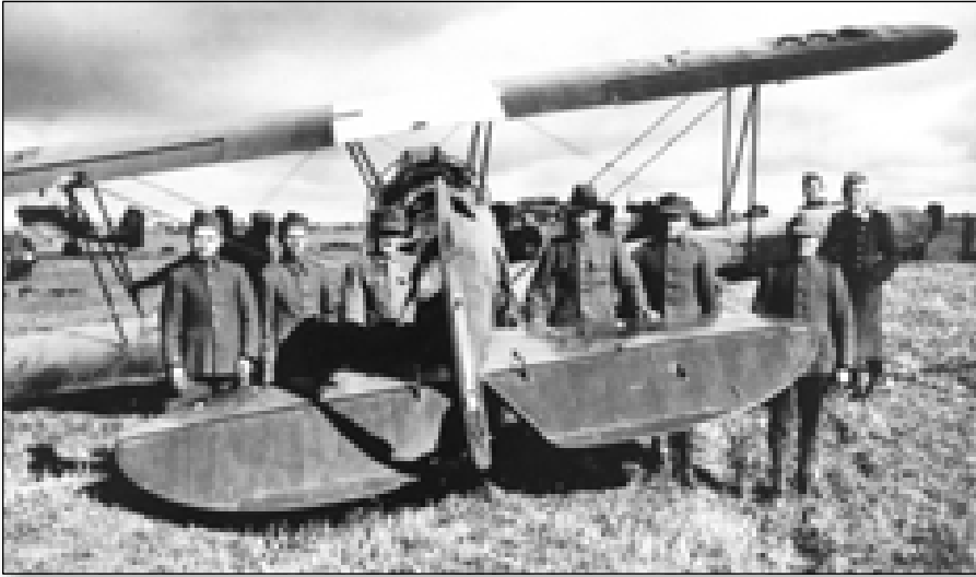
PWS-26 na lotnisku w Sadowie. Przy pracach porządkowych wykorzystywani byli wzięci do niewoli polscy żołnierze. Zwraca uwagę jasnoniebieski baldachim. W tle samoloty Junkers Ju-87 (TJK)