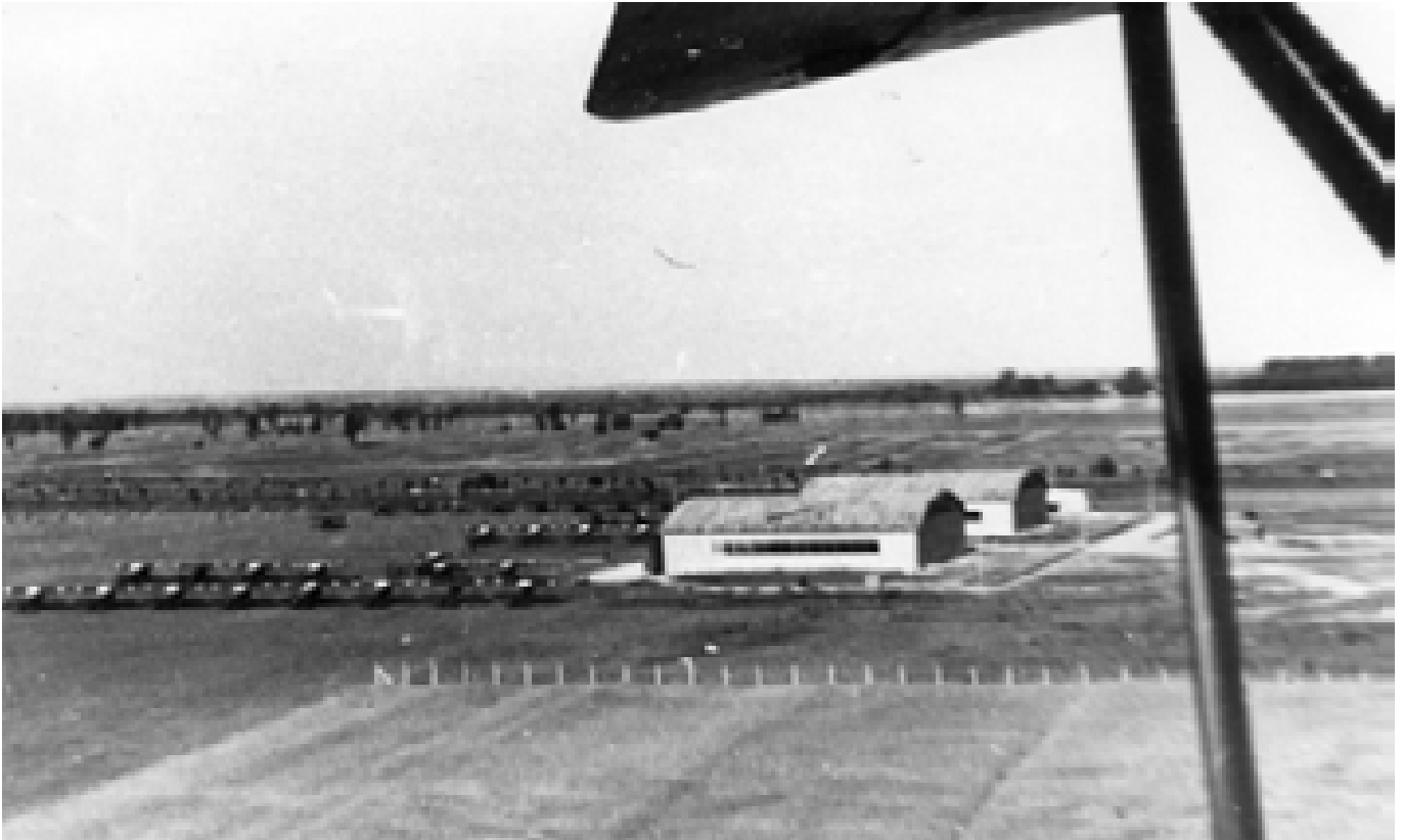
Widok na płytę lotniska i hangary w Borowinie (Gołębiu). Zdjęcie wykonane w okresie przedwojennym (Stratus).