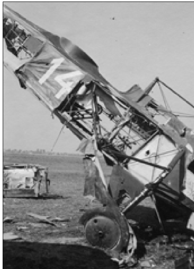
Seria zdjęć przedstawiająca kadłub Lublina R-XIII nr 146. Na dolnej fotografii wspomniany Lublin widoczny od tyłu pośród wraków PWS-26 i Karasia. Na pierwszym planie kadłub Lublina R-XIIIF z dwucyfrowym numerem bocznym (5?). Po lewej burcie Lublina R XIIIF leży kadłub PWS-26 nr 16 (81.151)