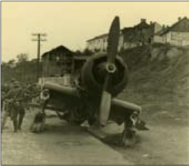
Karaś nr 7 (44.17) prawdopodobnie należący do CWL Dęblin sfotografowany w Łęcznej na tzw. „szosie lubelskiej”. W głębi na skarpie widoczny budynek tamtejszej synagogi. Szosa lubelska biegła w tym fragmencie wzdłuż skarpy nad rzeką Świnką. Widoczny na zdjęciu obok drewniany płot znajdował się nad parowem w którym płynęła Świnka (TJK/MR).