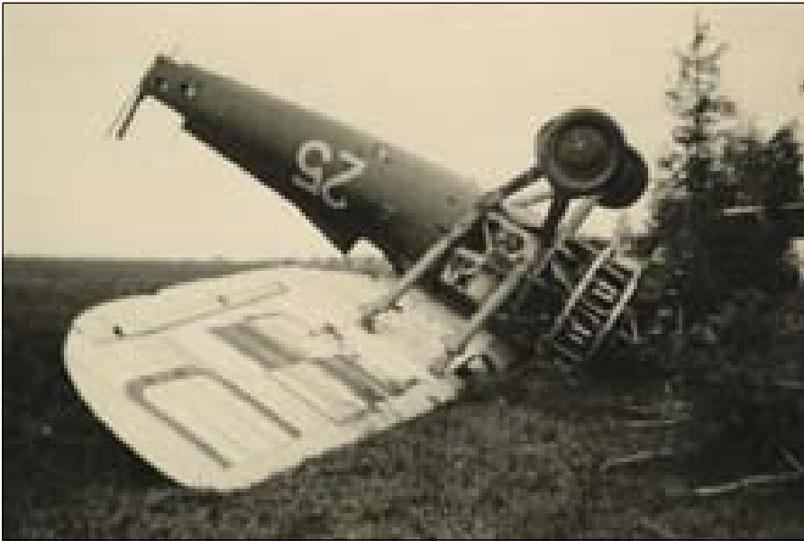
Porzucone samoloty PZL P.7a ze Szkoły Pilotażu w Ulężu. PZL P.7 nr 25 na zdjęciu po lewej i nr 19 ? na powiększeniu poniżej (TJK/MR.)