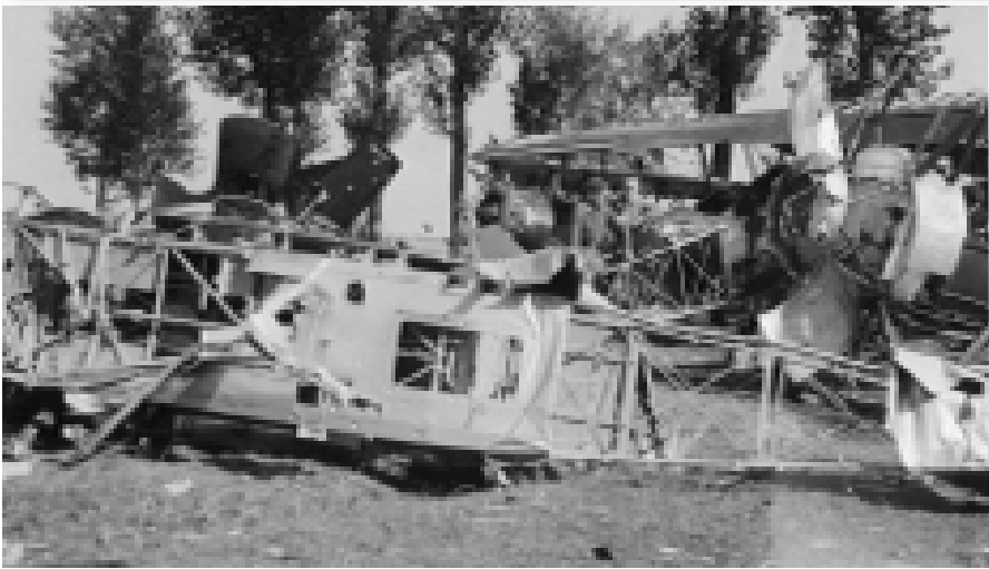
Wraki samolotów PWS-26 i Bartel BM-5d w Radomiu. Na zdjęciu środkowym znakomicie widoczna charakterystyczny panel inspekcyjny w dolnej części kadłuba PWS-26 (TJK).