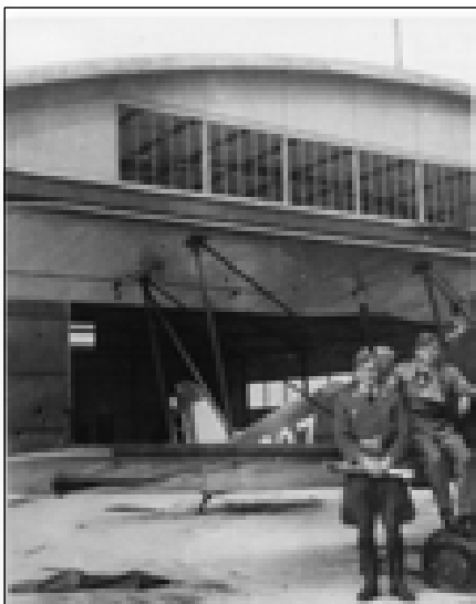
Pamiątkowe zdjęcie z Borowiny. Z lewej Oblt. Raabe dowódca eskadry 3.(H)/12 wchodzącej w skład 10 Armii z Opola i Lt. Jung (TJK).