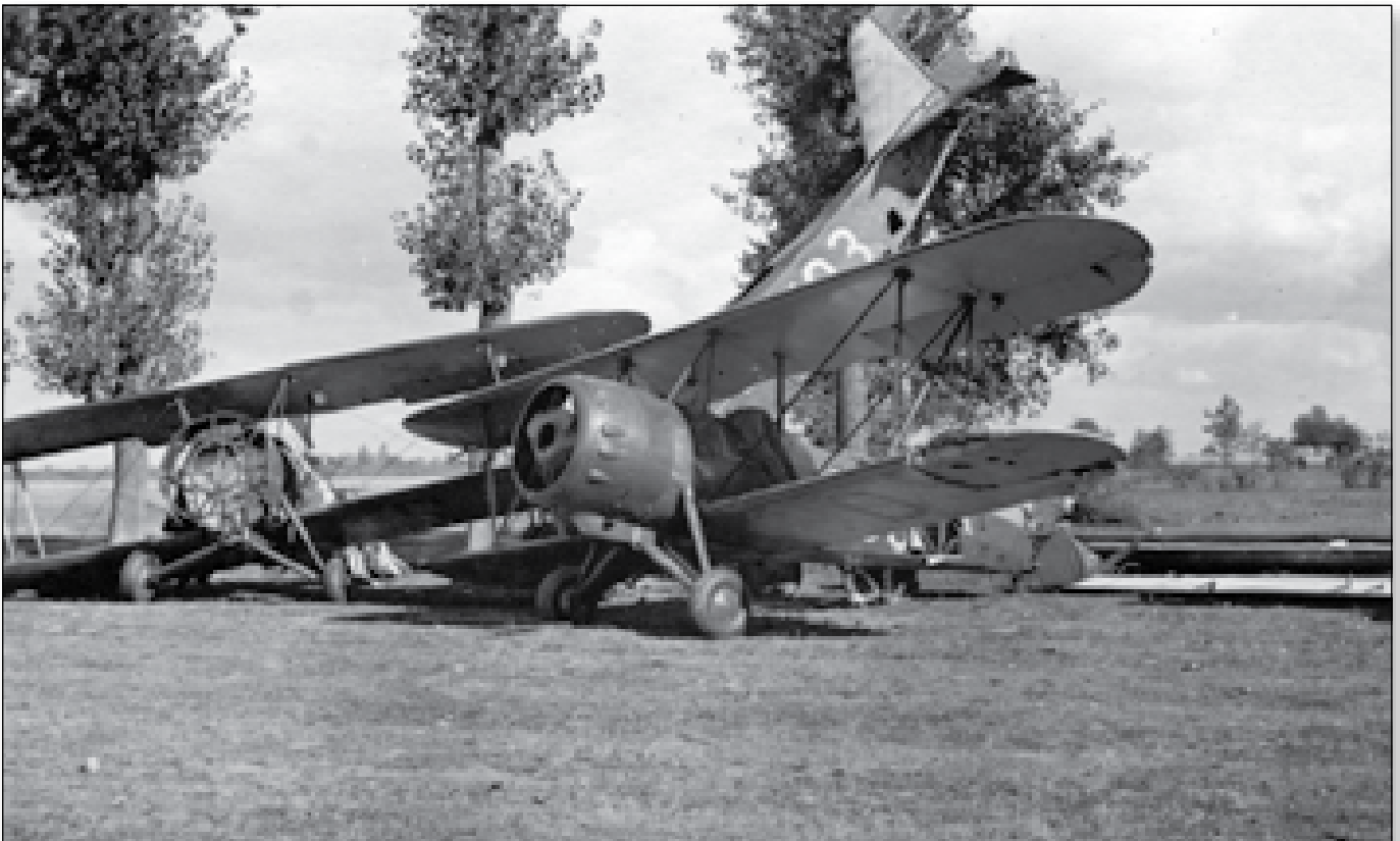
Na dolnym zdjęciu na pierwszym planie widoczny PWS-26 nr 208-D (81.221), Bartel BM 5d nr 103 (53.25) oraz, bez silnika, prawdopodobnie PWS-26 nr 204-R (TJK).